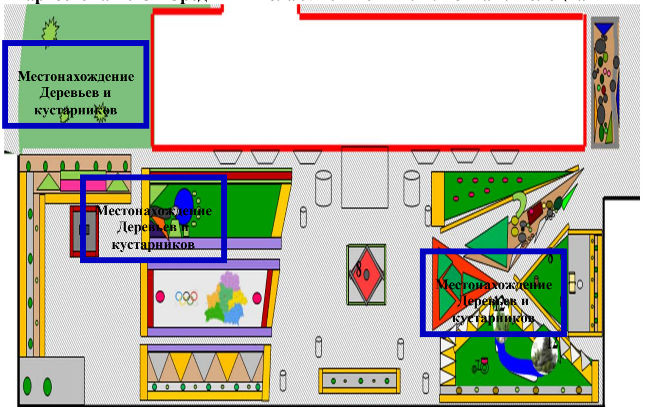
Картосхема ГУО «Средняя школа №10 имени В.М. Азина г. Полоцка»